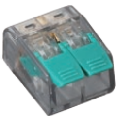
BORNMK622 Peso 2grs.

Construcción Fabricado en policarbonato transparente Clase de protección al fuego V2 Temperatura de servicio 85°C Temperatura máxima 115°C Origen PRC