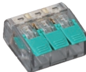
BORNMK623 Peso 3grs.