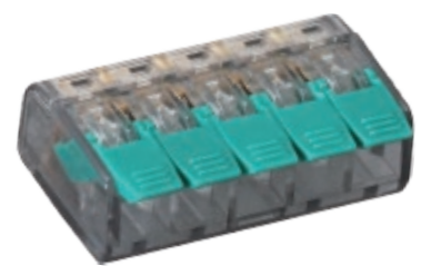
BORNMK625 Peso 5grs.